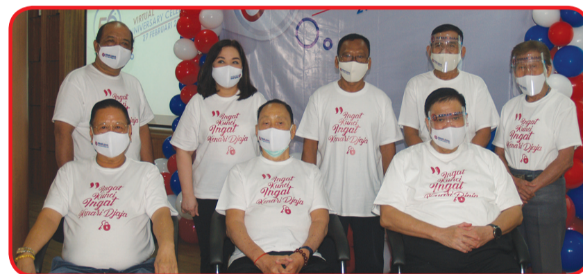
Jajaran direksi generasi pertama berfoto bersama karyawan senior Kenari Djaja.