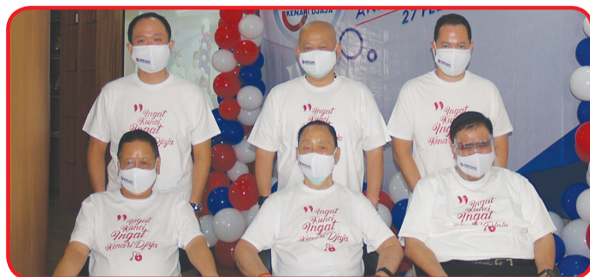
Jajaran direksi generasi pertama dan generasi kedua.