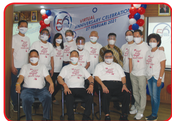
Jajaran direksi generasi pertama dan generasi kedua berfoto bersama tamu undangan.