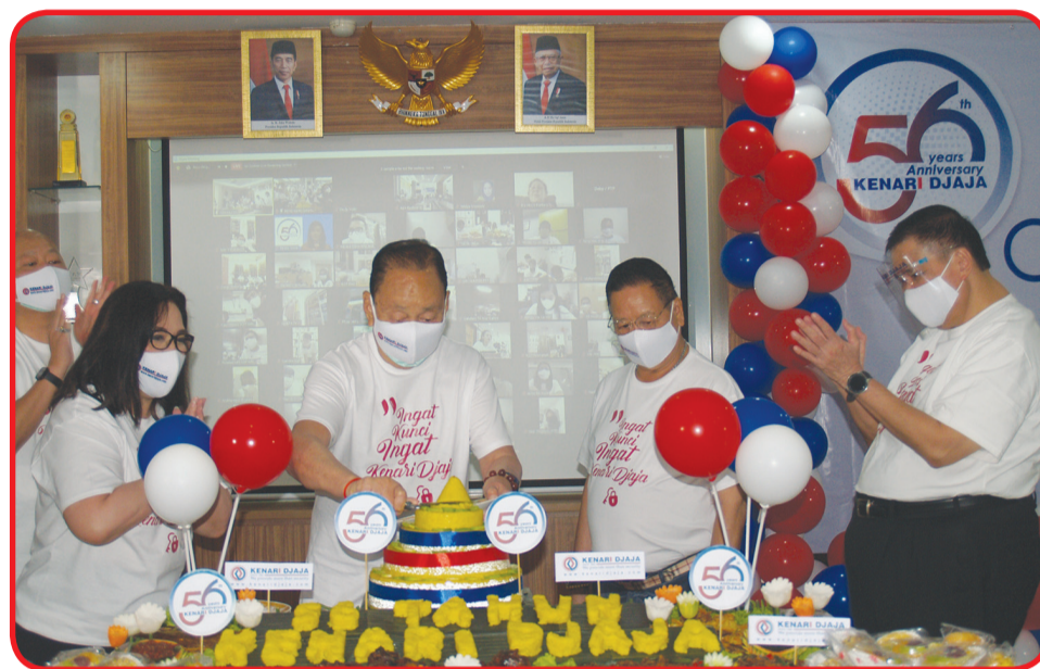
Prosesi pemotongan nasi tumpeng.

Pada acara ini juga menerapkan Protokol Kesehatan yang ketat mencuci tangan, cek suhu, memakai masker dan pelindung wajah juga diwajibkan test rapid antigen bagi yang hadir langsung atau offline. • kris