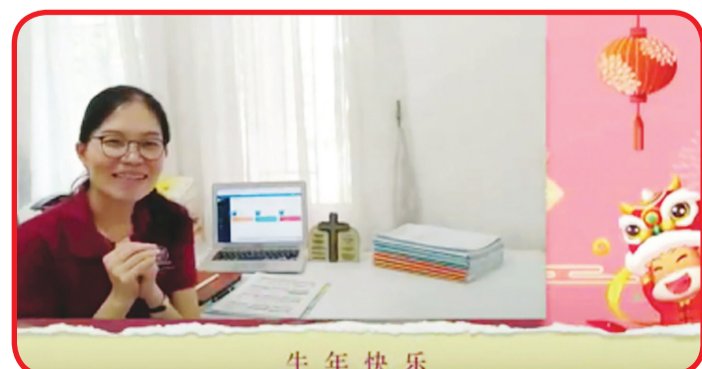
Salah seorang guru Raffles Christian School Pondok Indah mengucapkan Selamat Tahun Baru Imlek.

Upaya guru membaca pinyin membuat penonton tertawa. YouTube live room juga sangat hidup. Dan siswa mengirim jawaban di di message area satu demi satu. Sesi tanya jawab yang sederhana dan menarik membawa para guru dan siswa untuk memasuki budaya tradisional Tiongkok lebih jauh sekaligus memahami lebih banyak pengetahuan mengenai Tahun Baru Imlek. • idn/din