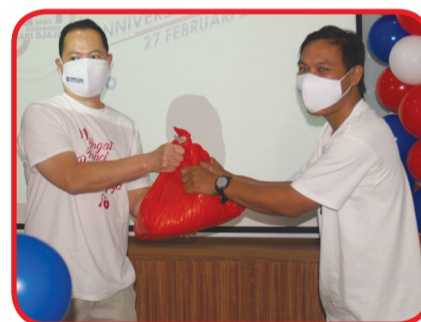
Penyerahan paket sembako kepada karyawan.