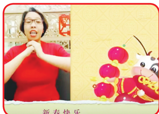
Salah seorang guru Raffles Christian School Pondok Indah mengucapkan Selamat Tahun Baru Imlek.