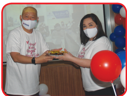
Pemberian nasi tumpeng kepada karyawan.