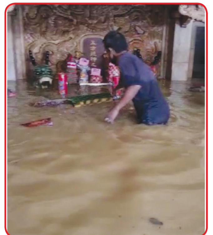
Seorang petugas menyelamatkan benda-benda yang ada di kelenteng saat musibah banjir.